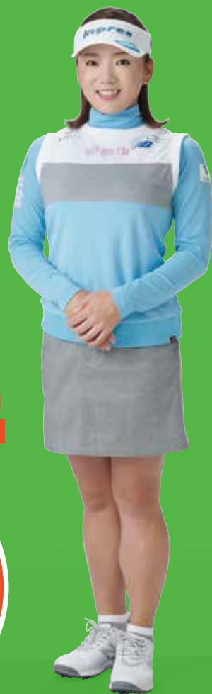
プロゴルファー 有村智恵